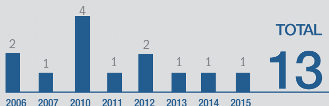
NOMBRE D'ENTREPRISES DÉTENUES PAR DES FONDS TRUFFLE CAPITAL, QUI SE SONT FAIT COTÉES ENTRE 2006 ET 2015

Sur 62 entreprises financées par des fonds gérés par Truffle Capital, pas moins de treize ont été cotées sur Alternext et accompagnées par Truffle après la cotation, soit 21% du portefeuille global. L'équipe de Truffle Capital bénéficie ainsi d'une expertise singulière sur la gestion des entreprises cotées, en plus d'une expertise dans l'innovation. NB : l'investissement en sociétés cotées ne garantit pas la performance ou la future cotation des entreprises non cotées en portefeuille.